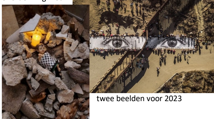
twee beelden voor 2023

Gedicht: "Er was eens ..." van Swendeline Ersilia