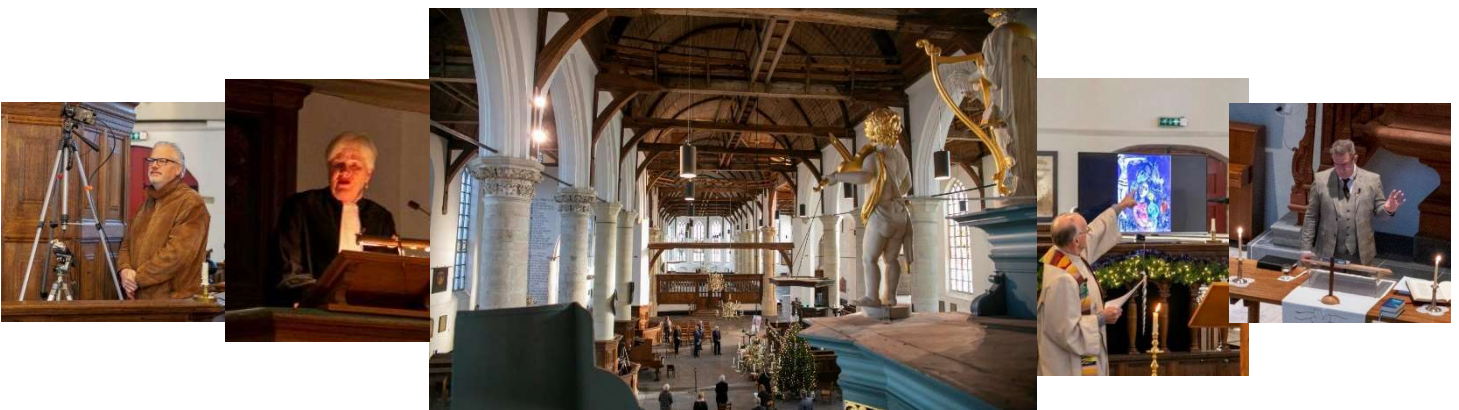
Waar anders honderden Kerst vieren

De opnames van beide vieringen zijn aangevuld en nu zonder uitval van beelden te zien op Kerkdienst Gemist .