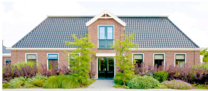
Thuis van Leeghwater (foto website)

De eerste collecte is vandaag bestemd voor de Stichting Hospice Thuis van Leeghwater in de Middenbeemster. Een liefdevolle en thuis vervangende omgeving voor mensen in hun laatste levensfase.