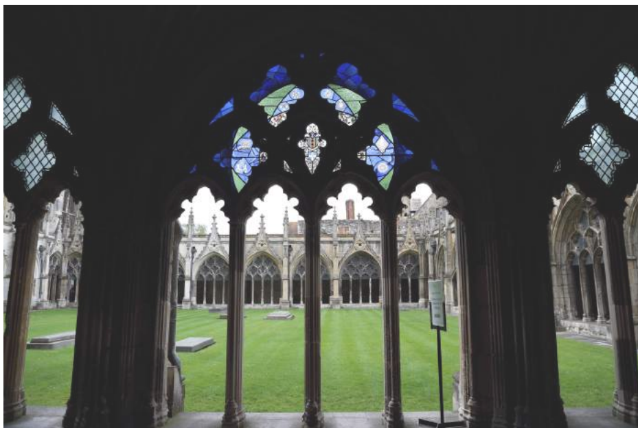
Canterbury Cathedral, kerkreis Engelse reformatie 2015